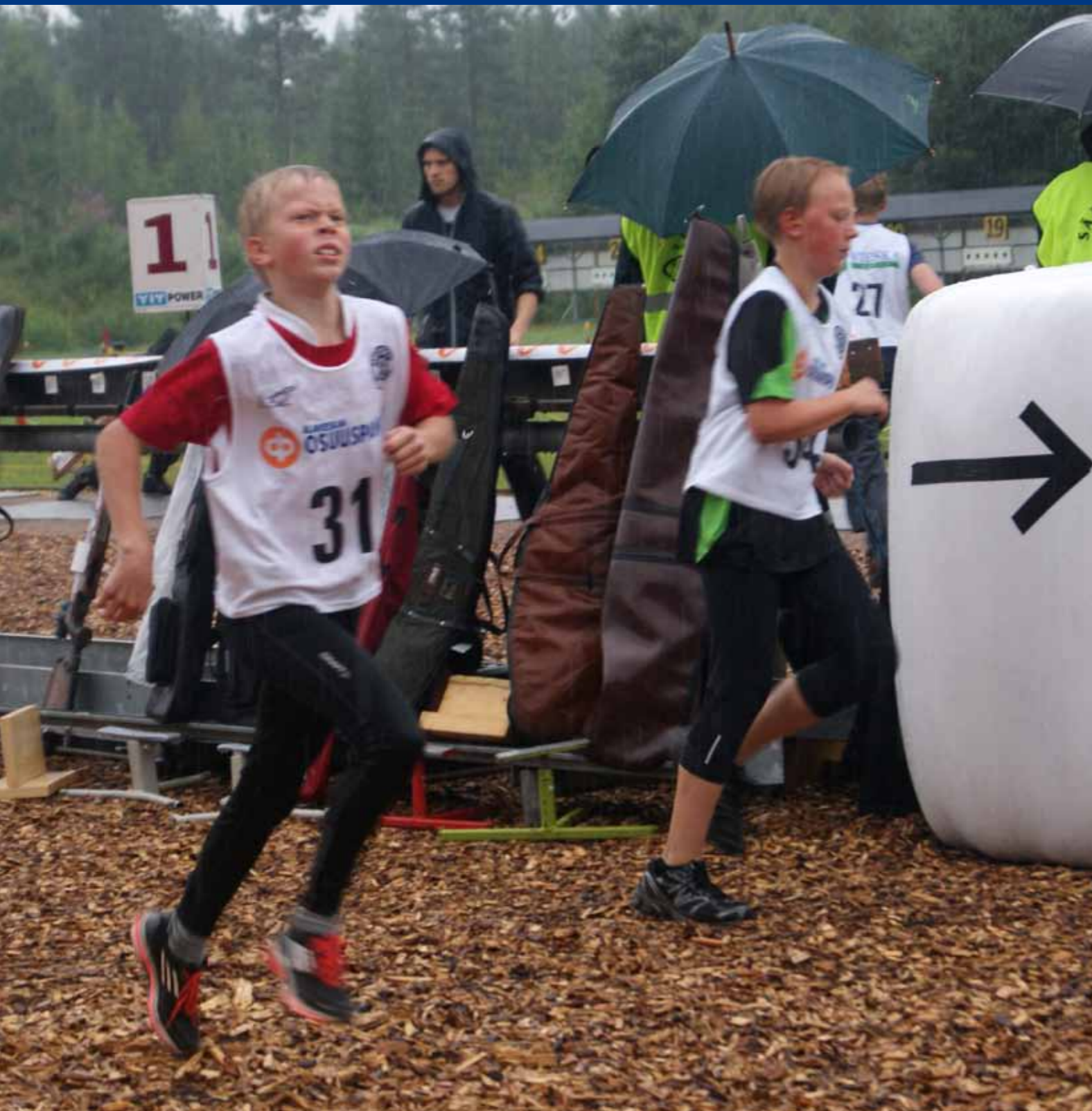
SM-kilpailujen nuorten sarjojen kohdistuksissa riitti kuhinaa.

Nuoret löytävät hyvin tiensä ampumajuoksun pariin. Elokuun alussa Alavieskassa käydyissä SM-kisoissa oli ennätysmäiset noin 370 osallistujaa, joista yli sata juoksi nuorimpien eli 13-vuotiaiden sarjoissa. Poikia oli lähes 60 ja tyttöjä melkein 50.