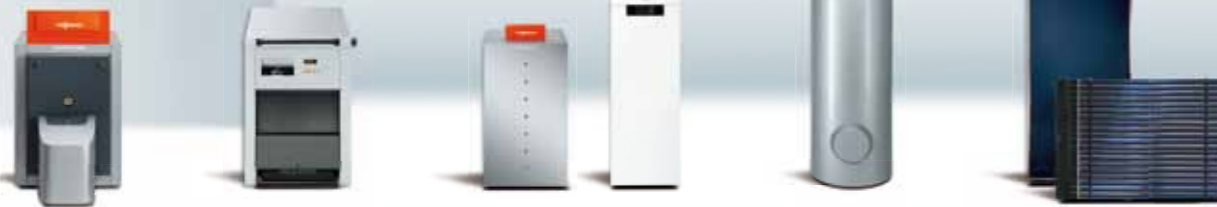
Keskisuuret ja suuret öljy- ja kaasukattilat

Menestykseen energiatehokkuudella. Ampumahiihdossa ja lämmitystekniikassa.