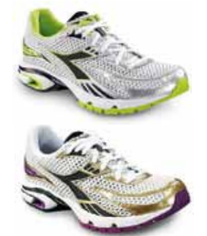
▲ MYTHOS SAMURAI III 159€